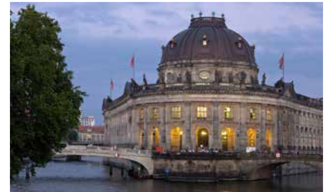
Museum Insel